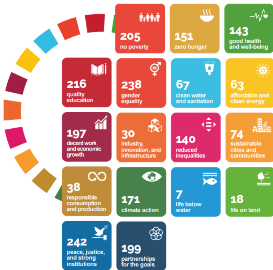
Рис. 2 Кількість проєктів, що реалізуються AVSI Foundation задля досягнення Цілей сталого розвитку (2024 р.)

Ці проєкти зазвичай охоплюють такі сфери як психічне здоров'я та психосоціальна підтримка (MHPSS) – «Game Connect» безпосередньо працюють на цю ціль, використовуючи спорт для зниження рівня стресу та депресії; гігієна та санітарія (WASH) – профілактика інфекційних захворювань через забезпечення громад чистою водою та навчання правилам гігієни («кільце» Здоров'я у програмі «5 Rings»).